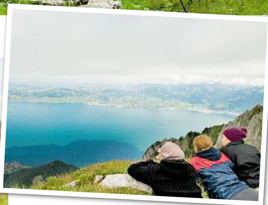
A gauche: Paul Zollet, le responsable de l'alpage de Taney. Ci-dessus: le sommet du Grammont offre un panorama à couper le souffle sur le lac Léman.