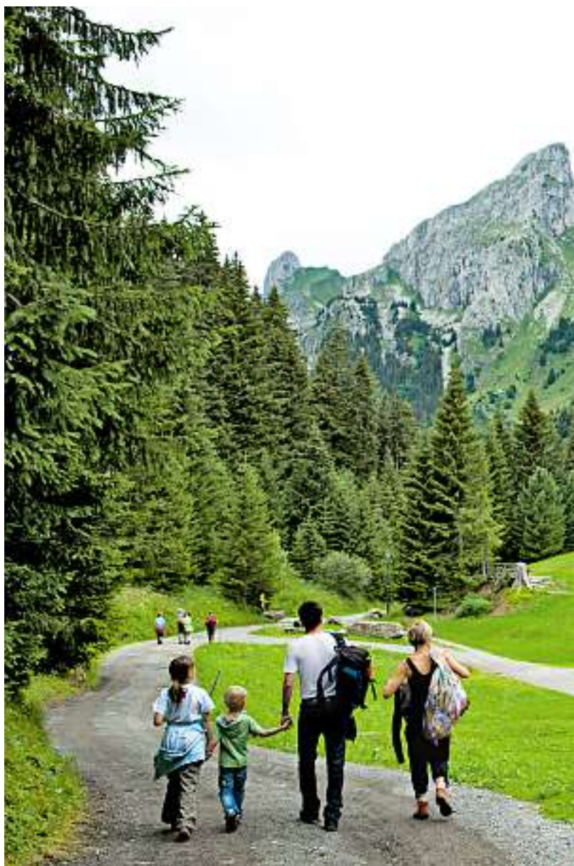
La montée de Miex jusqu'au Grammont prend environ trois heures.

«Le dimanche soir, les gens de Taney sont contents de revoir partir les visiteurs», glisse l'un des résidents du lieu, déplorant le chauvinisme de ses voisins. Une poignée vit ici à l'année. A la belle saison, la trentaine de chalets fait le plein, en revanche.