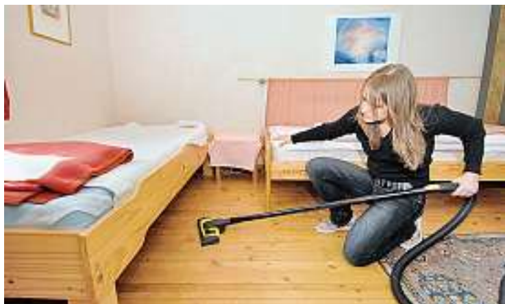
Unique dans le canton de Vaud: l'apprentissage en économie familiale.